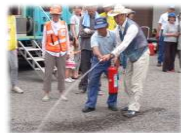
水消火器による消火作業訓練