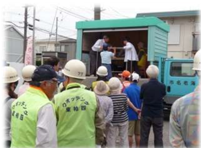
起震車に乗って震度の体験